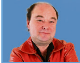
Von Kamil Krejci*

Gerne trinke ich ein Gläschen Wein. Vielleicht auch mal zwei oder mehr. In geselliger Gesellschaft ist dies lustig und anregend. In Massen genossen, sei es gesund, sagen nicht nur Winzer, sondern auch Ärzte. Französische Doktoren empfehlen sogar eine grössere Menge als hiesige.